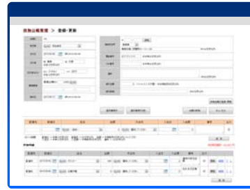
<供物台帳管理画面>