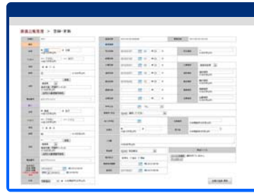
<葬儀台帳管理画面>