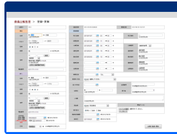
<葬儀台帳管理画面>