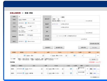
<供物台帳管理画面>